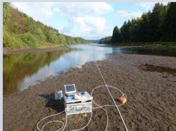
Fluxmessungen Talsperre Königshütte