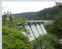
Messstation an der Rappbode Vorperrre

Kontinuierliche Messung der \text{CO}_2 Konzentration im Talsperren-Observatorium Rappbode.