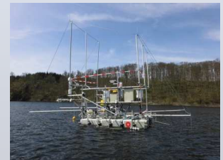
schwimmende Messplattform mit Eddy-Covarianz Messtechnik (Kooperationspartner TU Dresden)

DFG Projekt zusammen mit TU Dresden (Dr. U.Spank)